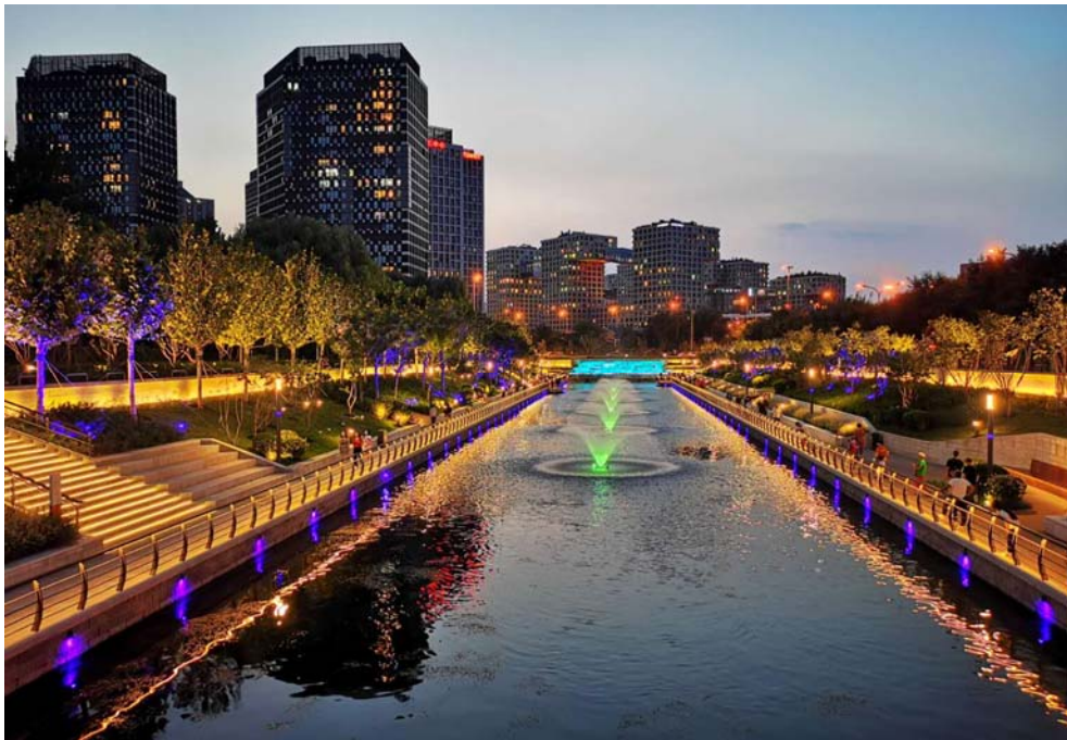
完工照片—源头夜景