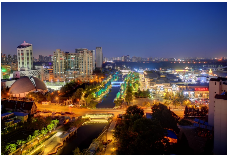
完工照片—蓝色港湾段夜景

项目批复总投资约 96490.29 万元，为市区两级投资，其中市级投资 18603 万元，区级投资为 77887.29 万元。截止目前，累计收到市级资金 16000 万元，收到区级资金 73000 万元，2019 年底财政收回 28419.47 万元，累计支出 49115.13 万元。