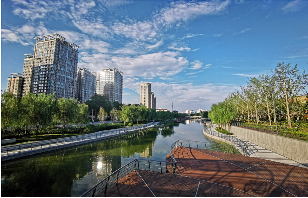
完工照片—蓝色港湾段日景