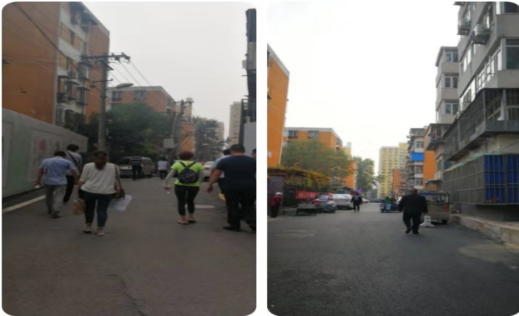
三丰路入地前后对比（雅宝路地区）