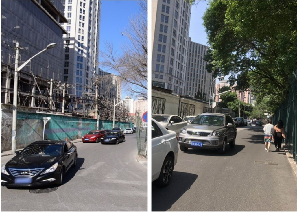
秀水西街入地前后对比（雅宝路地区）