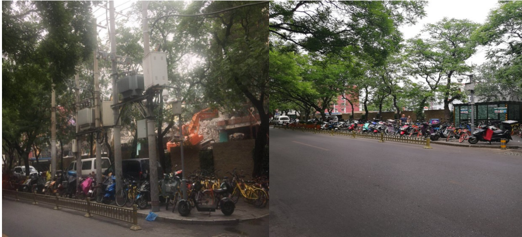
三里屯路入地前后对比（三里屯地区）

朝阳区重点地区电力架空线入地项目的实施，能够改变现有变压器负载情况，提升地区整体环境和景观。